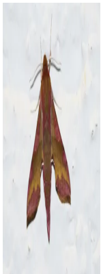
[lexicon='Kleiner Weinschwärmer'; '"] [lexicon='Deilephila porcellus'; '"]

Einsteiger können diesen mittelgroßen Schwärmer mit dem Kleinen Weinschwärmer [lexicon='Deilephila porcellus'; '"] verwechseln, dessen Vorderflügel aber deutlich rosa umrandet sind.