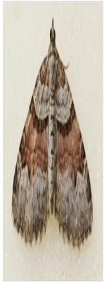
[lexicon='Kohl-Blattspanner'; '"] , [lexicon='Kreuzblütler-Blattspanner'; '"] [lexicon='Xanthorhoe designata'; '"]

Der ähnliche Helle Binden-Blattspanner Xanthorhoe decoloraria ist eine relativ seltene, alpine Art.